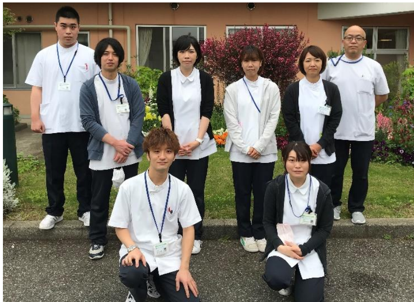
リハビリスタッフ